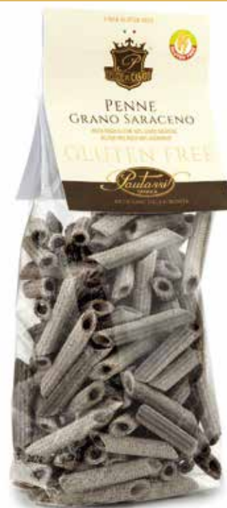
■ penne grano saraceno buckwheat penne