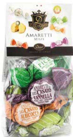
AMARETTI MISTI ASSORTED AMARETTI