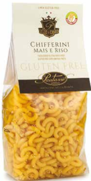
■ chifferini mais e riso corn and rice chifferini