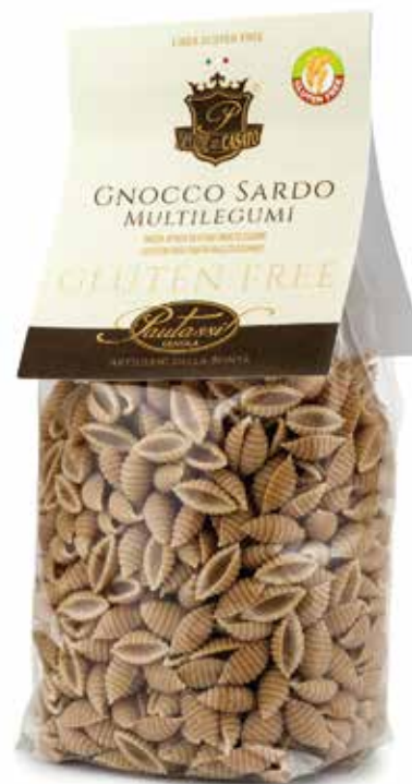
■ gnocco sardo multilegume legumes gnocchi