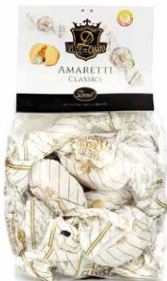
AMARETTI CLASSICI CLASSIC AMARETTI