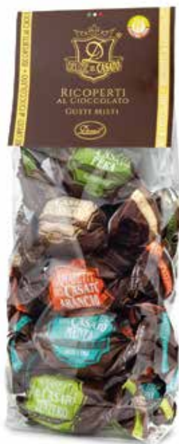
AMARETTI MISTI RICOPERTI AL CIOCCOLATO ASSORTED CHOCOLATE-COVERED AMARETTI