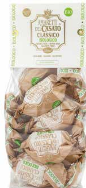
AMARETTI CLASSICI BIO ORGANIC CLASSIC AMARETTI