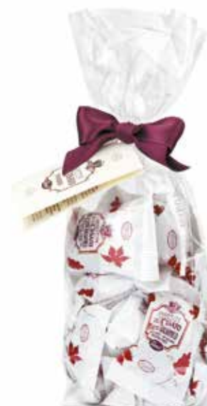
AMARETTINI ALL'ACETO BALSAMICO BALSAMIC VINEGAR AMARETTINI