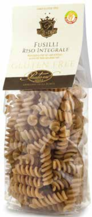
■ fusilli riso integrale brown rice fusilli