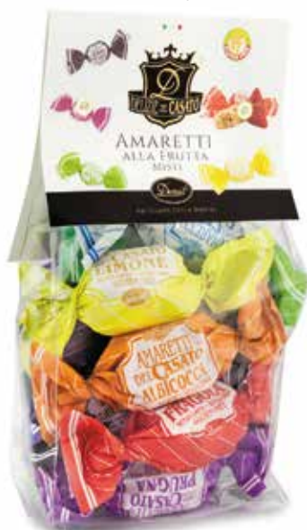
AMARETTI MISTI FRUTTA ASSORTED FRUIT AMARETTI